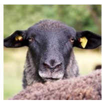
Die rauwolligen Pommernschafe