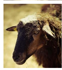
Die Krainer Steinschafe