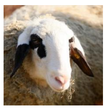
Die Kärntner Brillenschafe