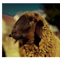
Die braunen Bergschafe